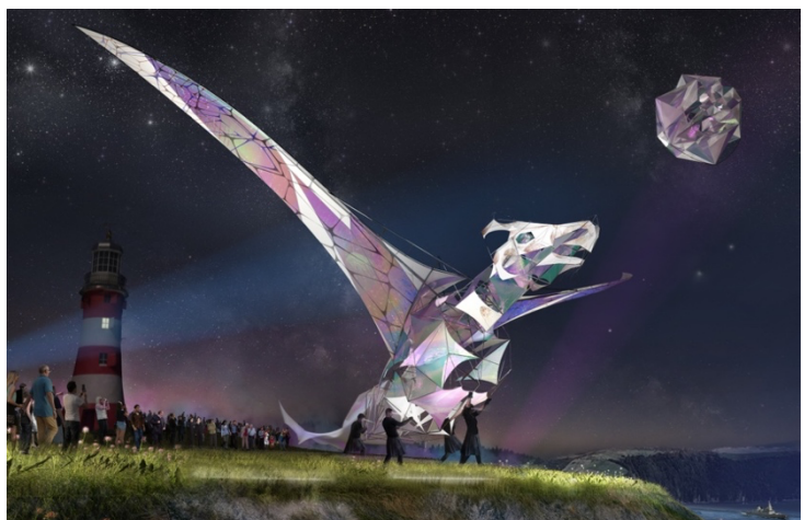
Carl Robertshaw - The Hatchling

Due imperdibili appuntamenti vi aspettano mercoledì 24 aprile , giorno in cui apriranno le mostre dedicate a due degli artisti più attesi di quest'anno. Il primo è il pluripremiato wind artist britannico Carl Robertshaw , che dalle 10.00 alle 17.00 presenterà al pubblico "The Hatchling: how we did it" , il famoso dragone che celebra il matrimonio fra il mondo dell'aquilone e quello del puppetry. A questa spettacolare opera, realizzata dopo la pandemia e per questo divenuta simbolo di rinascita , ARTEVENTO