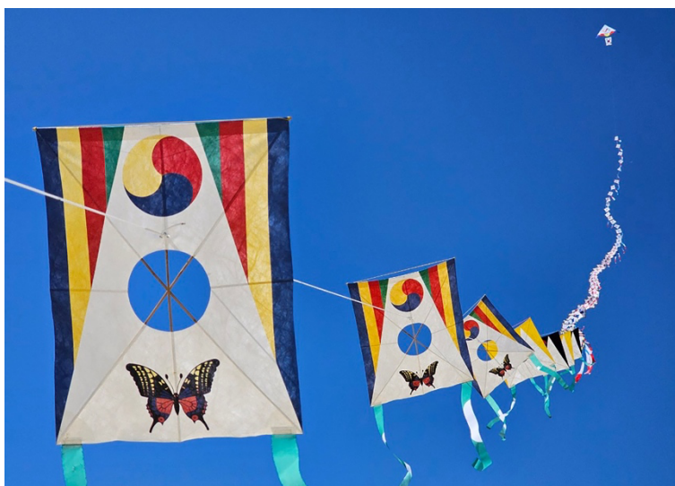
Corean Kite - ARTEVENTO 2024

Inoltre, ARTEVENTO festeggia la sua 44° edizione ampliando l'area dello spettacolo e raggiungendo con la sua travolgente ventata di colore e allegria anche la nuova Piazza Premi Nobel ribattezzata per l'occasione Kite Circus Village e vestita a festa per ospitare tutti i giorni lo chapiteau di Circo Madera – circo contemporaneo (senza animali) coprotagonista di questa edizione – e, a grande richiesta, il primo ristorante ufficiale del festival .